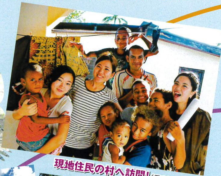
現地住民の村へ訪問！(予定)